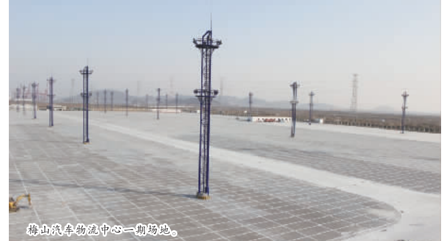
梅山汽车物流中心一期场地。

项目在2014年2月开工，总投资3.3亿元，占地430亩，可同时停放1万辆汽车，具备每年10万辆的整车进口物流能力。项目建成后，将开展拆箱查验、仓储物流、PDI改装、展览展示、分拨运输等一体化服务。 “现在有了这个基础设施，配合梅山的多功能码头，将为梅山今后进口整车提供坚实的保障。”中信港通有关负责人说。