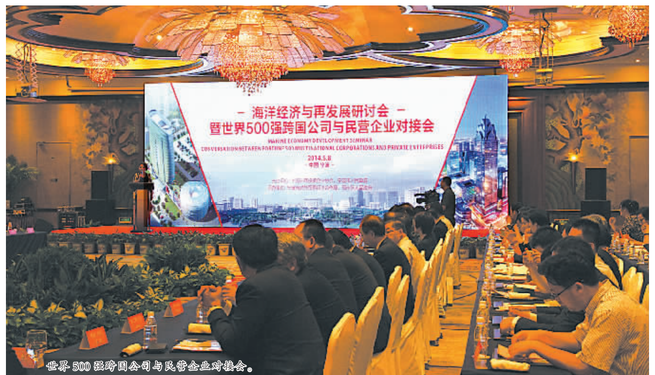
世界500强跨国公司与民营企业对接会。

去年以来，外资大企业大项目继续向重点开发区域集聚，重点开发区域利用外资主导作用进一步发挥。2014年全市重点开发区域实际利用外资达25亿美元，占到全市利用外资总额的62%。在新批的联合利华、丰田汽车、路易达孚、摩根大通和宝洁等5家世界500强投资项目中，有4家落户重点开发区域。上海大众总投资190亿元中型轿车整车二期项目与杭州湾新区签约并全面启动。总投资超500亿元的深宝能综合旅游服务业项目落户奉化开发区，并计划在年内开工建设。据统计，2014年全市整合提升后的19个重点开发区域引进10亿元以上50亿元重大内外资投资项目25个，合计总投资1127亿元，超额完成市政府下达的全年重大投资项目招商引资任务。