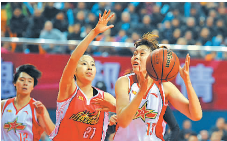
图为比赛中的镜头。