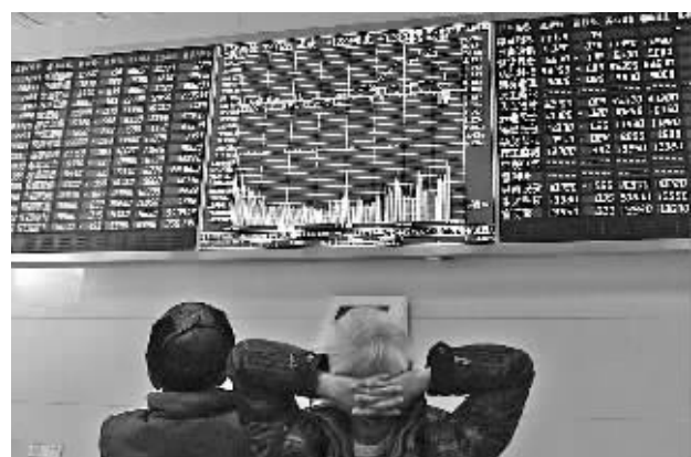
1月9日,股民在浙江省杭州一家证券营业部股票交易大厅里关注股市行情。

到目前,市场投资者更多仍在关注油价的进一步演绎。由于美国页岩油气革命,美国的油气产量大幅上升,进口减少,以沙特为首的欧佩克组织拒不减产,原油的主要定价影响因素逐渐由欧佩克转移到页岩油气的生产情况。“但即使下跌,页岩油气开采停产可能根本不存在。”国泰君安期货分析师董丹丹认为,在产业格局上,页岩油的发展阶段基本处于2012年的页岩气发展时期,这一阶段的价格下滑,从页岩油的历史和页岩气已经走过的历程看,页岩油产量对价格敏感度较低,未来产量恐难下滑。(据新华社)