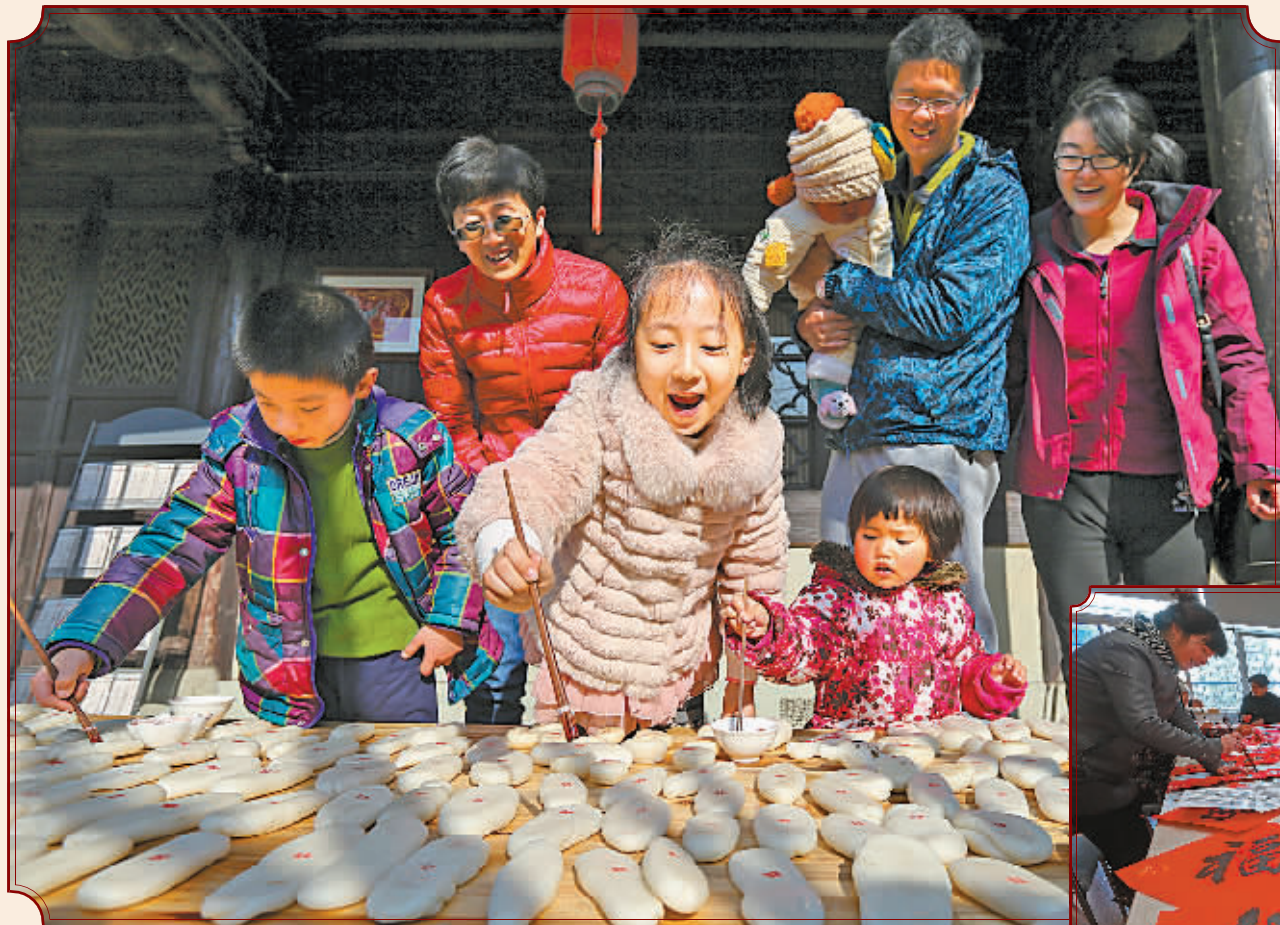
连日来,江东区东胜街道王家社区组织辖区内的书画爱好者创作了300多副春联、福字,将在春节前送给社区居民。

程中,有一些年纪稍大的车主对各大媒体的微信等免费发放平台不太熟悉,有的甚至缺乏微信等平台的操作经验。为方便市民申领,宁波市自驾游旅游协会决定通过各媒体相关平台的免费发放活动结束后,委托宁波旅游咨询服务中心(中马路159号)受理剩余的2000本护照申请。市民只要提供身份证原件和复印件、驾驶证原件和复印件以及2寸照片2张,就可直接办理申领登记手续。《宁波自驾游护照》免费发放活动截至时间为1月20日。