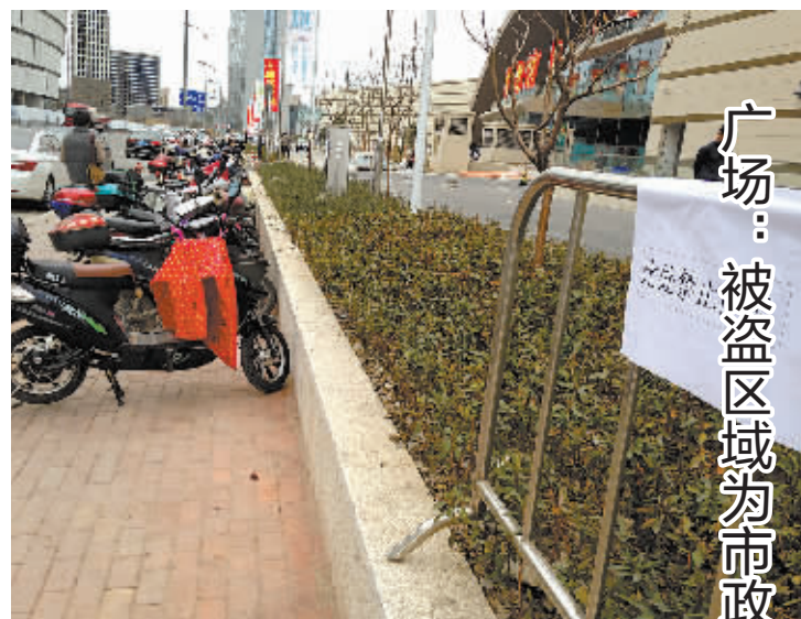
虽然贴了提醒语,但2号门外路边仍停了很多电动车。