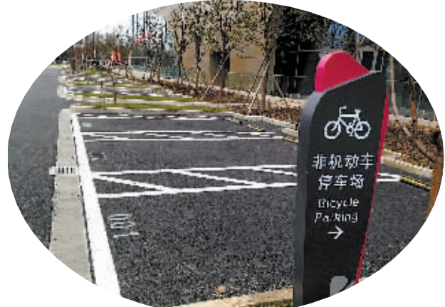
1号门附近这12个车位将改造为非机动车停车场。

本报讯(记者沈孙晖) 去新开业的宁波高鑫广场逛街吃饭,谁知出来时电动车电瓶被人撬了,旁边还有几辆电动车也遭“毒手”。市民王女士非常郁闷,昨天在论坛发帖,吐槽广场管理不力。 王女士告诉记者,1月10日傍晚5时左右,她骑电动车带着孩子,去位于海曙新街路的高鑫广场吃饭逛街。王女士将车停在2号门附近的路边,“我见许多电动车并排停着,所以也停在那里。”