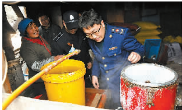
图为查处现场。