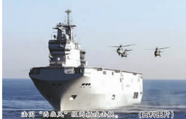
法国“西北风”级两栖攻击舰。(资料图片)

“西北风”级两栖攻击舰是法国研制的第四代两栖战舰,长199米,宽32米,满载排水量2.1万吨,具备远程兵力投送及两栖作战指挥能力,可搭载直升机、水陆两栖装甲车、坦克等重型装备以及900名士兵。