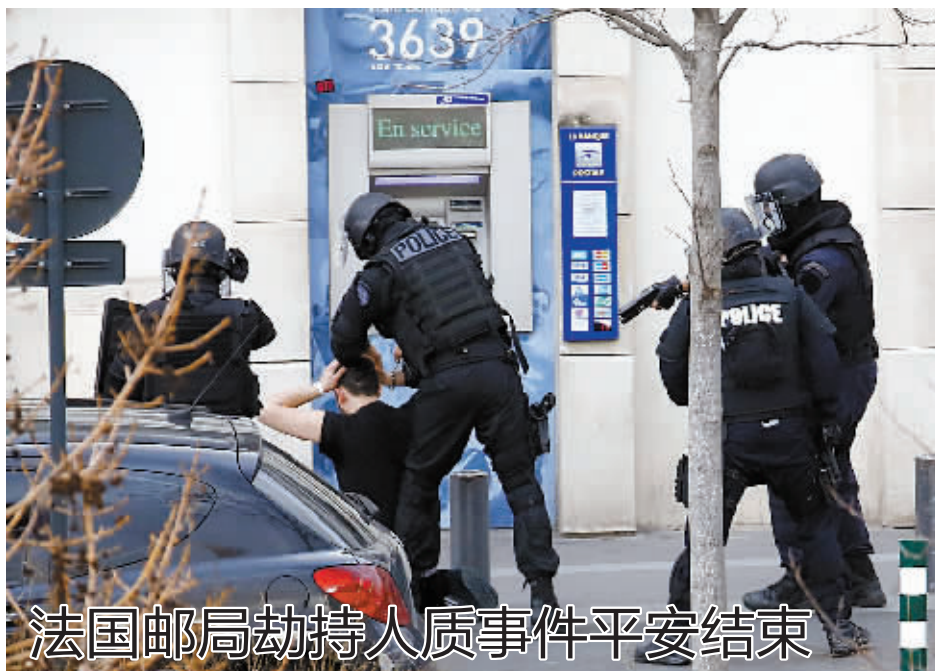
法国邮局劫持人质事件平安结束

据新华社巴黎1月16日电 (记者郑斌) 法国《世界报》网站和法国国内广播电台16日报道说,当天上午,巴黎火车站因发现可疑包裹,警方疏散了站内人员并关闭车站。约两个小时后警报解除,巴黎火车站重新开放,火车运行正逐渐恢复正常。