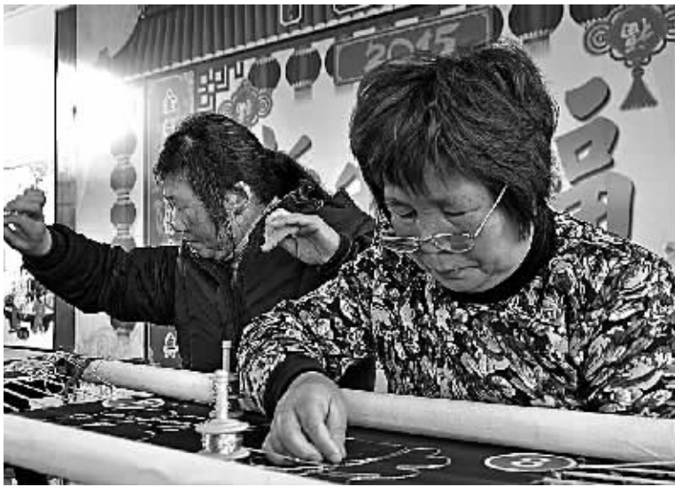
鄞州区下应街道日前举办“金银彩绣双学双比”大赛。活动现场，来自湾底村、史家码村等13支参赛队伍进行角逐，最终用时最短且作品最整齐的史家码村两位参赛选手获得第一名。