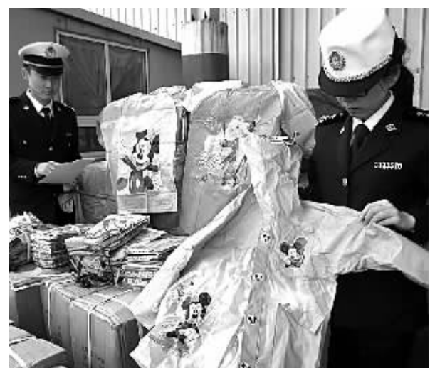
近日，宁波海关在出口渠道查获20箱共1200件侵犯“Barbie（芭比）”、“MICKEY MOUSE device（米奇马）”商标权的雨衣。

据悉，软寸水库总库容2.44亿立方米，站装机容量1600千瓦，预计2017年建成。届时，该水库可每年向本市提供1.26亿立方米优质水。