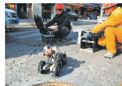
施工人员在调试“管道内窥检测”机器人。

据介绍,此次实施的第一阶段管道检测范围共涉及污水管道44公里,计划在明年春节前后完成检测。