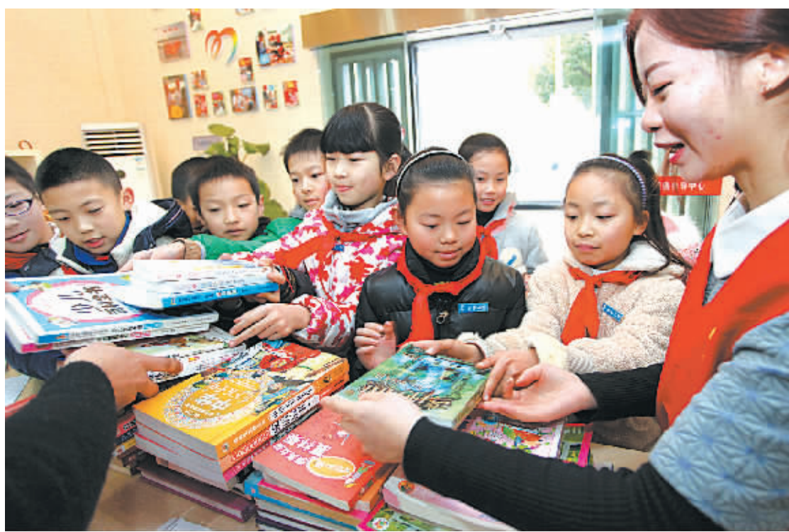
昨天,余姚市世南小学的孩子们正在踊跃捐赠课外读本。由共青团余姚市委、市志愿者协会发起的“万人万卷”公益图书捐赠活动得到了该市社会各界积极响应。目前,已募集的近万册图书将于下月底前送到结对的青海省天峻县家庭贫困的中小生手中。