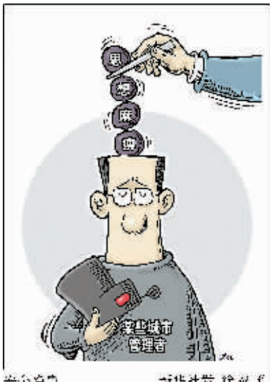
安全委员会 奇伟社设计

“领导干部思想麻痹是城市公共安全的最大隐患,安全责任落实不力是城市公共安全的最大威胁。”