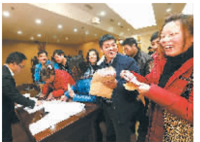
1月21日,农民工在法院领回被拖欠的工资。

当日,上海浦东法院首次启动“民薪工程”,对一系列涉民生案件进行集中执行,对拖欠农民工薪酬的“老赖”采取强制措施。在当庭执行的执行款发放仪式上,共有83名农民工领到120余万元企业欠薪。“民薪工程”是浦东法院针对追索劳动报酬、赡养费等民生案件执行启动的专项工程,包括提前介入、集中执行、司法救助等配套机制。