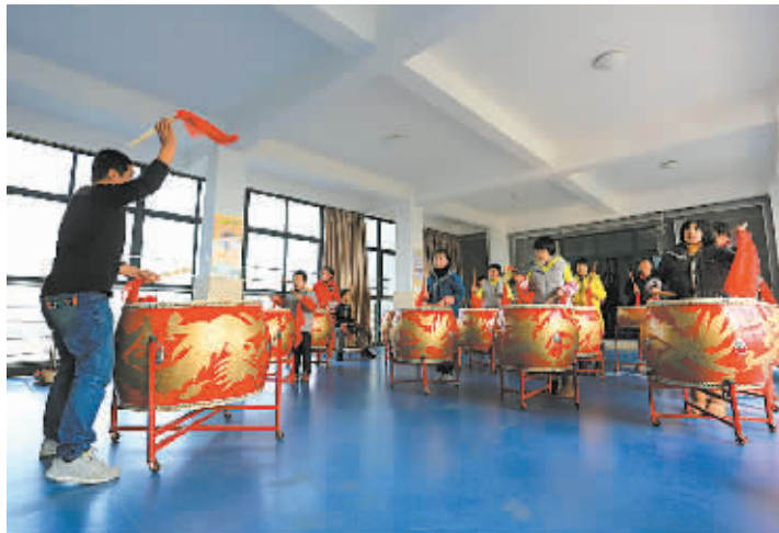
图为文化馆老师在给孩子排练打击乐。

积极创造条件,为这些特殊孩子排练节目,提供更多上台演出、展示自我的机会,用艺术打开通往他们内心的大门。