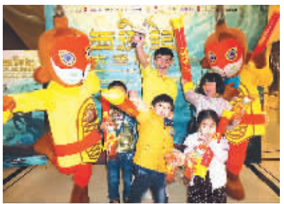
昨晚,3D动画电影《西游记之大圣归来》全国亲子活动在宁波举行,现场以“大圣来了”为主题,邀请小朋友一起变身“孙大圣”,吸引了我市许多小朋友踊跃报名参加,活动现场开展了萌娃魔幻变装秀,最后评选出“小悟空”奖和“最奇葩装扮”奖,现场气氛热烈。图为活动现场。(南华/文)