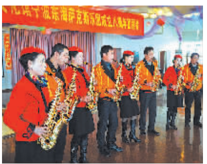
1月22日下午,海曙区文化馆宁波东海岸萨克斯乐团在格威咖啡店举行建团8周年暨迎新春团拜会,乐团成员现场表演了民族弹拨乐器、独唱、甬剧、萨克斯等16个节目,迎接新年的到来。该乐团由我市退休职工组成,8年以来,乐团深入社区和敬老院演奏,丰富了老年人的精神生活。