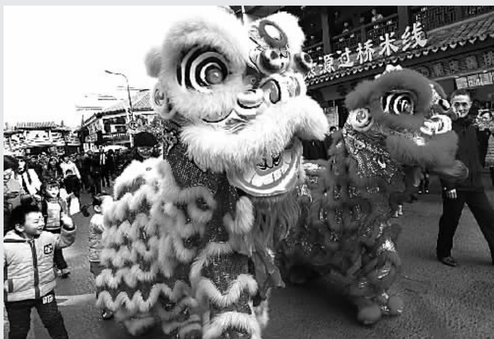
昨天上午，两头金灿灿的狮子巡舞在海曙区鼓楼沿步行街，为2015年甬台文旅商交流活动助兴。

本报讯（记者张正伟 海曙记者站张黎升 通讯员邵斌伟）浓香四溢的阿里山烤肉、响声震天的锣鼓、欢快刚猛的舞狮……昨天上午10点多，和煦的阳光刚刚洒满迎阳桥，鼓楼沿里已经人山人海、快乐一片。2015年甬台文旅商交流活动周正式拉开了帷幕。