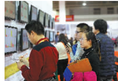
图为各地客户在唐狮秋季订货会上挑选精品。

近年来，博洋、GXG、太平鸟等宁波服装企业不断发力时尚高端，吸引年轻消费群体。唐狮2012年开始进入品牌革新期，精粹提炼出“Live it Real: 活出真我”的潮流生活态度，完成从大众休闲服饰品牌到潮流时尚服饰品牌的华丽蜕变。