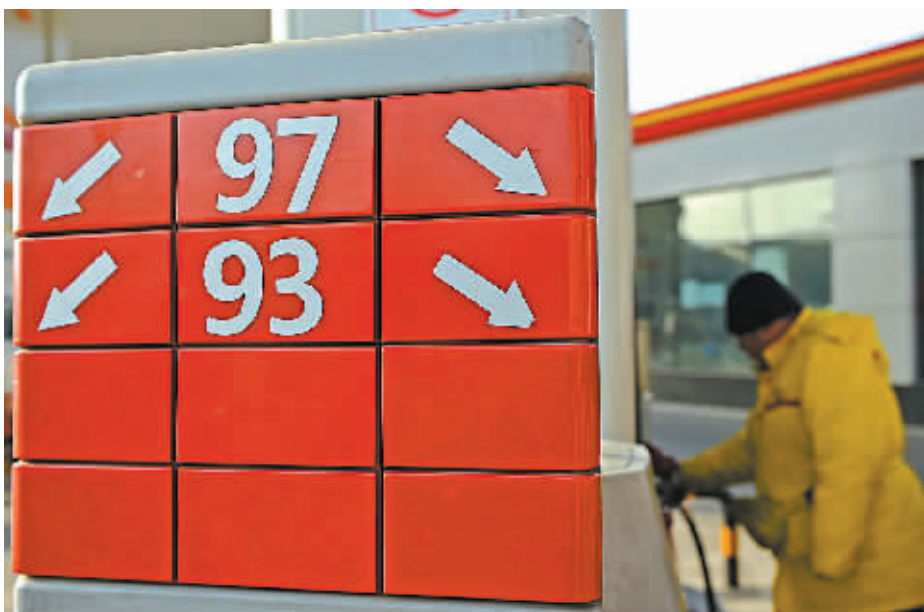
1月26日，一家加油站工作人员在为顾客加油。

纵然深陷“大熊市”，主要产油国却坚持高产政策不动摇。石油输出国组织（欧佩克）最新发布报告显示，去年12月欧佩克日产量3020万桶，环比增加14万桶，超过3000万桶的产量上限。其中，伊拉克去年12月石油产出增至35年来最高。美国能源信息局最新发布的数据显示，美