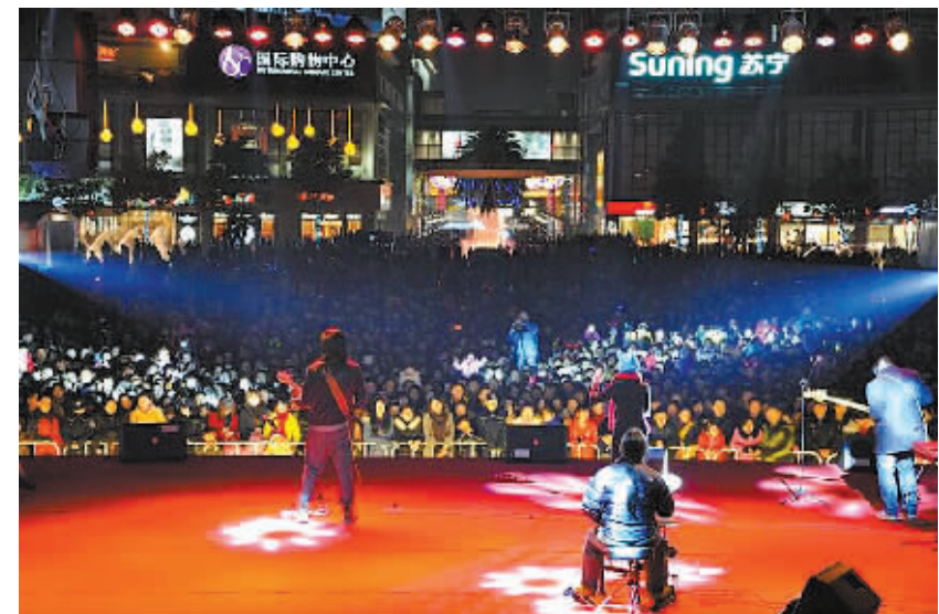
夜晚的天一广场流光溢彩,最近举办的一场晚会吸引了上千名市民游客参与,为海曙的“月光经济”增添光芒。