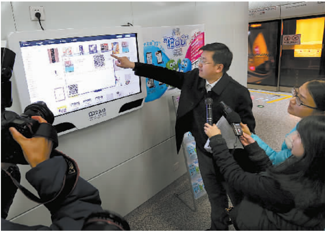
昨日，在轨道交通樱花公园站，工作人员在介绍数字图书馆屏幕阅读、U盘下载、手机扫码等功能。

“数字图书馆所有电子书不受借书、还书的控制，同时多人使用也不受人数限制。”一位现场负责人介绍，数字图书馆的云平台，汇集了超过5万册的图书、3万集有声图书、3800种期刊及50万分钟的海量视频资源。不久的将来，乘客可以通过客户端进入到云平台，享受海量阅读和视听的乐趣。