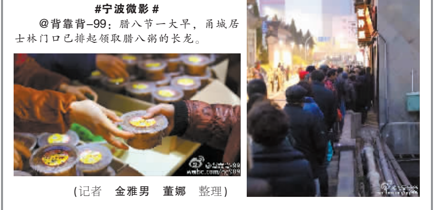
(记者 金雅男 董娜 整理)

#您播报# @ 可怜的水告:一大早就收到了满满的感动。当我的车徐徐停靠在鄞州人民医院站时,打开车门,上来一位女士,手捧一碗粥:“师傅,吃碗腊八粥。”顿时觉得心里暖暖的。