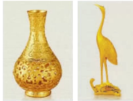
▲建设银行贵金属产品