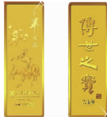
▲农业银行贵金属产品