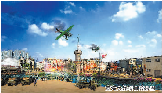
黄海大战项目效果图