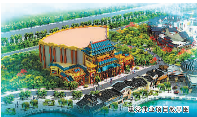
建党伟业项目效果图