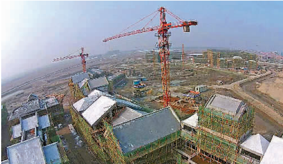
中国非物质文化博览园建设现场