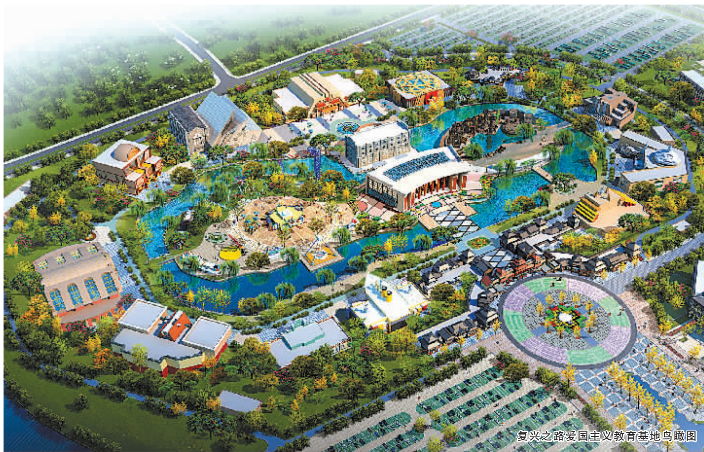
复兴之路爱国主义教育基地鸟瞰图

除华强项目外，杭州湾国家湿地公园、杭州湾梦幻欢乐水世界、“中国假期”项目、杭州湾优质海底温泉等项目遍地开花，越来越多的重大文化休闲产业项目陆续加入到新区文化产业“航母编队”中。大力发展文化产业，作为新区“2+3+1”主导产业中的重要内容正在加快实施中，一个年客流量千万人次的休旅目的地正在杭州湾畔快速崛起。