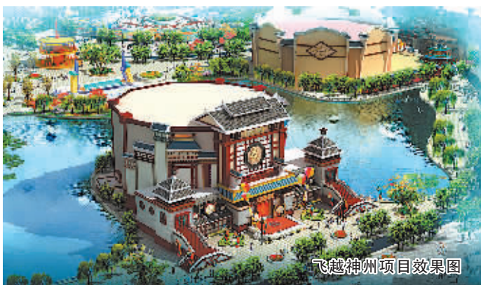
飞越神州项目效果图