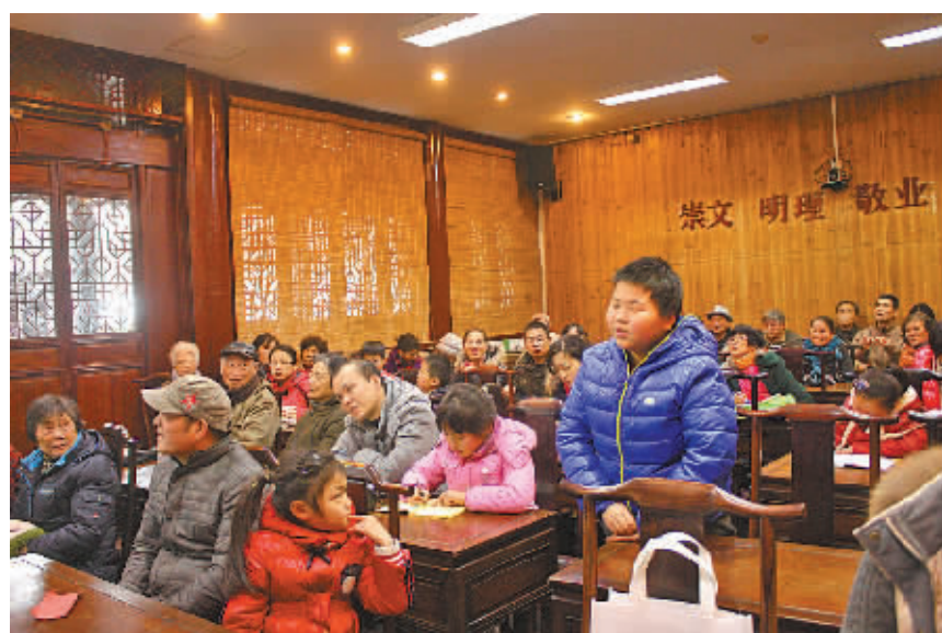
图为讲堂上孩子们提问。

本报讯(记者陈青 通讯员吴央央 郑薇)“北京人过年的时候必须要吃鱼,因鲤鱼跳龙门比较吉祥。”“台湾