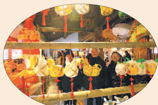
▲非遗馆内展示的传统手工扎制灯笼吸引了市民驻足。 ▲非遗传承人正在制作面塑。