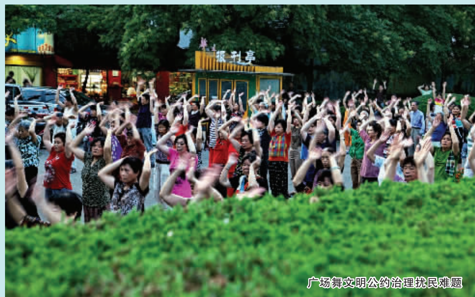
广场舞文明公约治理扰民难题

社区居民群众的力量和专业力量也动了起来。各街道探索“开放空间”治理模式，邀请居民、辖区单位人员参与公共事务出谋划策，商定解决方案。恒隆中心开展平安楼宇试点，律师、会计师、税务师等组成队伍服务商圈企业，此外依托检察官和心理专家队伍的专业特长，共同对未成年罪犯人进行心理疏导，被最高检列为15起创新未检工作典型案例之一。