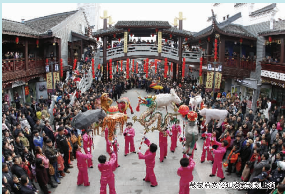
鼓楼沿文化狂欢宴频频上演

政府投入和民间投入多措并举，文艺精品生产再创佳绩。电影《一生有爱》、纪实文学《一个都不放弃》获省“五个一”工程奖；《南腔北调都是歌》、《小裁缝》获省“群星奖”。动画片《布袋小和尚》登陆央视首播，数字电影《我的老公是卧底》实现院线上映并入选浙江青年电影节。