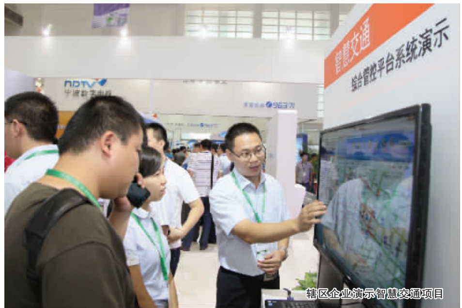
辖区企业演示智慧交通项目

去年以来，海曙区加快推进现代金融业、现代商贸业、国际贸易业、现代物流业发展，探索中心城区民生综合保险项目试点，推出夜间活动100余场，拉动社会消费品零售总额增长，搭建出口统保平台让企业获得贷款共计1000余万元，开发建设智慧物流项目完成物流业增加值25亿元。