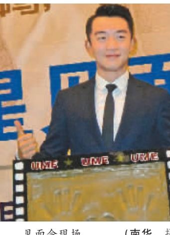
见面会现场。

本报讯（记者南华 通讯员赵燕娜 严福）由UME集团等出品、李欣蔓执导、江一燕和郑恺主演的爱情喜剧电影《有种你爱我》，昨日在宁波UME国际影城举行映后见面会，男一号郑恺亲临现场与“恺们”亲密接触，“小猎豹”的超高人气，为该片在甬城热映再添一把火。 在片中，郑恺饰演花心帅气、风流倜傥的查义，江一燕饰演傲娇脾气火爆、霸气十足的女权主义者左小欣，二人上演全然不同于传统模式的“先谈生活再谈情”故事。郑恺现场解释：“我本人是传统型的，但片中的爱情婚姻观在现时年轻人中有存在，故我就演绎了一下，这并不表示我就是片中人。”