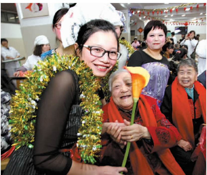
昨晚,身穿废弃材料制成环保服的志愿者正在海曙区广安怡养院走猫步,秀风采。当晚,该院举行的迎春晚会和“年夜饭”热闹进行。席间,大家各自准备才艺表演,精彩的节目给200多位老年人带来欢声笑语和新春祝福。

卢子跃肯定了广大女企业家为我市经济社会发展作出的积极贡献。他从如何认识新常态下的经济形势、把握新常态下的发展机遇、当好新常态下的企业发展先锋等三个方面,向女企业家们介绍了我市的经济运行情况和转型升级情况,分析了宁波市女企业家们面临的机遇和挑战,勉励女企业家继续发扬优良传统、锐意进取、勇担责任、创新发展,当好新常态下的企业发展先锋。他希望女企业家们要充分发挥韧性,当好创新转型“排头兵”;切实保持定力,守好实体经济“主阵地”;积极发挥爱心,提升社会责任“美誉度”。