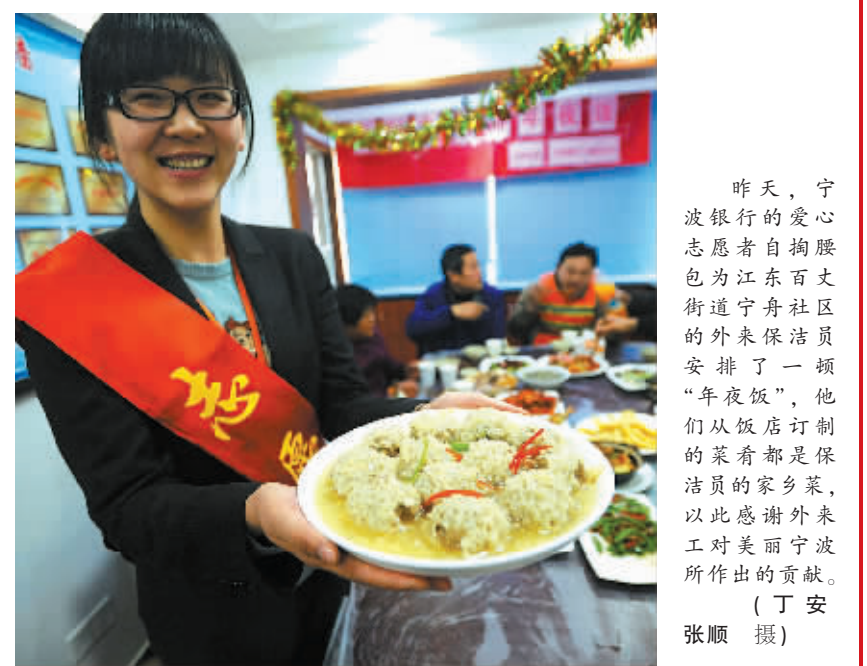
昨天,宁波银行的爱心志愿者自掏腰包为江东百丈街街道舟社区的外来保洁员安排了一顿“年夜饭”,他们从饭店订制的菜肴都是保洁员的家乡菜,以此感谢外来工对美丽宁波所作出的贡献。