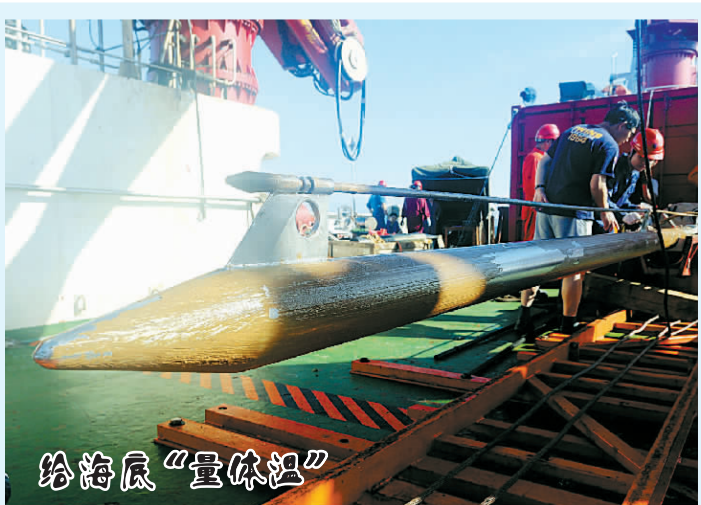
刚刚从近5000米海底回收的沾满深海软泥的“巨型体温计”——热流探针(2月9日摄)。“科学”号科考船9日在西太平洋雅浦海沟附近海域投放热流探针,以获取海底热流信息。科研人员将其比喻为给海底“量体温”。