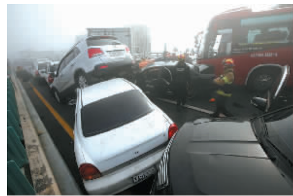
2月11日，在韩国仁川国际机场附近的大桥上，救援人员在车祸现场营救伤者。

据新华社首尔2月11日电(记者青霄)据韩联社11日报道，位于韩国仁川市的永宗大桥路段当天上午9时许发生一起百辆汽车连环追尾的严重交通事故，至当天下午已致2人死亡、65人受伤，伤者中有7名中国人。