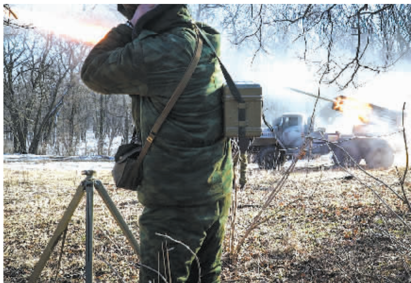
2月13日,在乌克兰顿涅茨克地区,乌克兰东部民间武装人员向政府军控制地区发射导弹。

新华社基辅2月14日电 有关火协议后,13日乌克兰东部硝烟再起,各方12日签署在乌克兰东部实施停战事继续,十多人在炮火中丧生,乌政