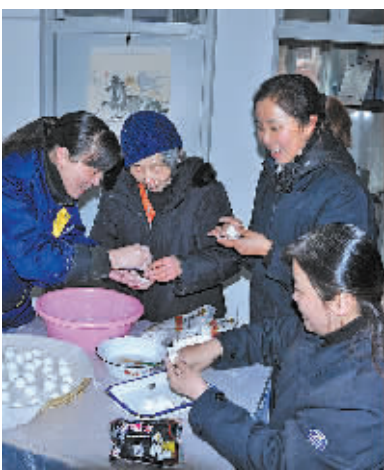
“女儿”们和老人一起包汤圆迎新。

日前,市公交总公司永安公司省城... 343线路组的驾驶员与老人相识于15年前。