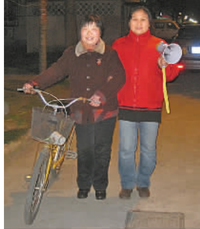
“夜呼”队回来啦!

本报讯(记者王伊婧 通讯员金建波)“各位居民,防火防盗,门窗关牢...”最近,每晚7时,海曙南门口街道柳锦社区又响起了这熟悉的声音。