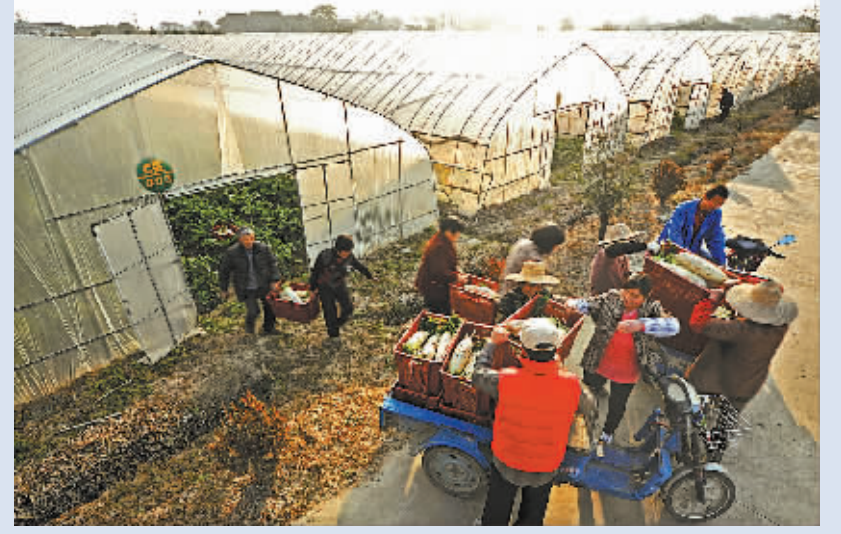
浙江省湖州市南浔区农民在当地一处现代农业园区搬运销往长三角城市的有机果蔬。

国家统计局浙江调查总队最新发布的年度统计数据显示:2014年浙江省农村常住居民人均可支配收入19373元,比全国平均水平高0.5倍,这已是浙江省农民人均可支配收入连续30年位居全国各省、自治区首位。在该省农民的收入结构中,人均工资性收入和经营性净收入分别达到11773元、5237元,成为收入增长的两大因素。