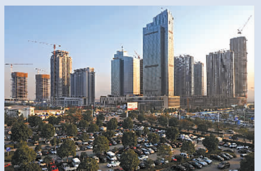
据浙江省统计局的最新统计数据:浙江2014年房地产投资从一季度的16.2%回升到全年的16.8%;商品房销售面积降幅从一季度的25.6%收窄到全年的4.3%。数据还显示:商品房销售量在浙江全面取消限购政策后的8月份明显上升,8至12月销售2629万平方米,同比增长14.6%。月均销量比前7个月平均增长79.8%。