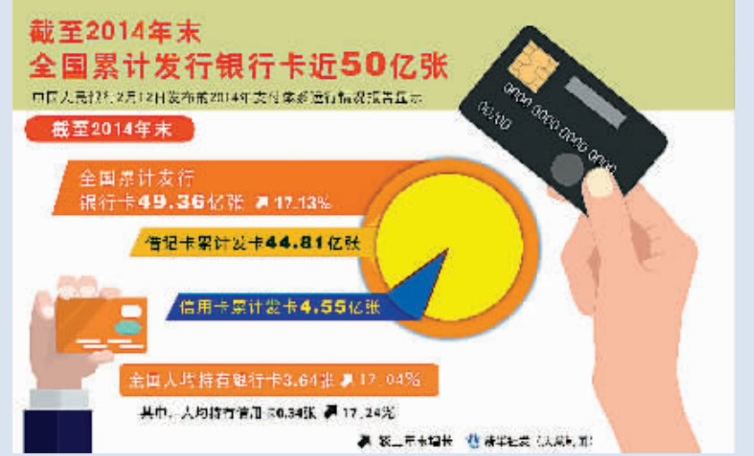
截至2014年末 全国累计发行银行卡近50亿张