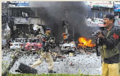
警察在爆炸现场警戒。