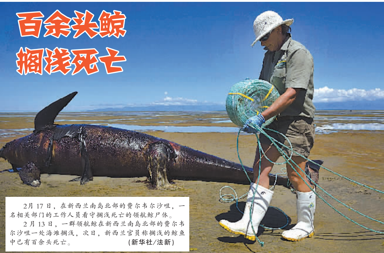
2月17日,在新西兰南岛北部的费尔韦尔沙咀,一名相关部门的工作人员看守搁浅死亡的领航鲸尸体。