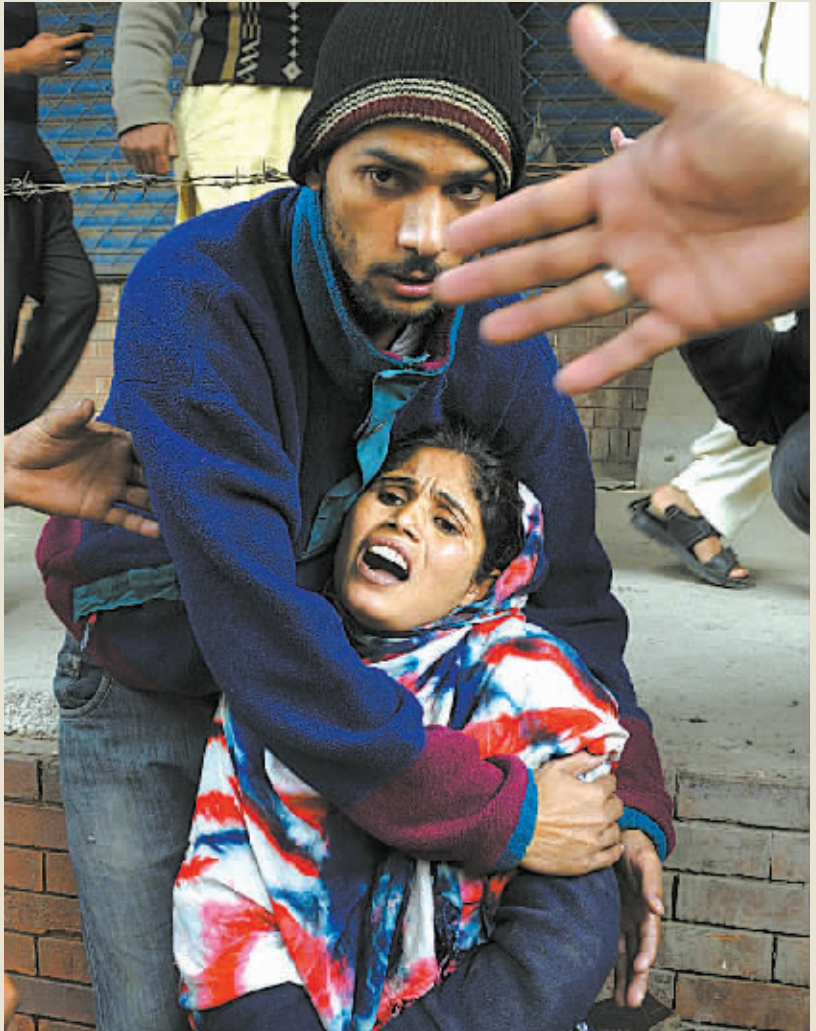
2月17日,在巴基斯坦东部城市拉合尔,一名男子在爆炸后保护一名女子。