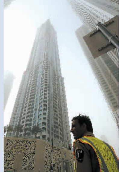
一名安全人员站在发生火灾的公寓楼附近。

新华社迪拜2月21日电 (记者刘瑜茜 李震)阿拉伯联合酋长国迪拜一幢79层的居民楼21日凌晨发生火灾,数千名居民紧急疏散。截至记者发稿时,大火已被扑灭,暂无人伤亡报告。