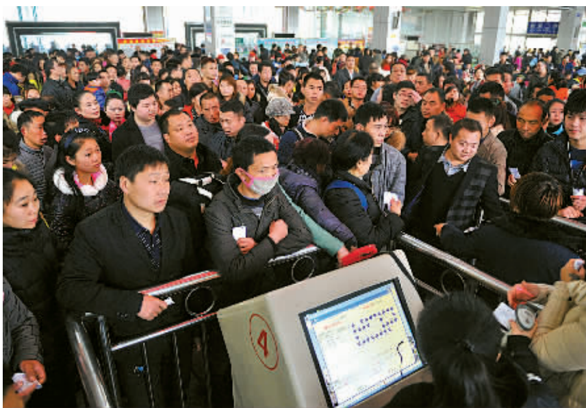
2月23日,旅客在四川南充汽车客运站候车大厅准备检票进站。

2月22日,全国铁路发送旅客757.2万人次,同比增加127.7万人次,增长20.3%。其中,武汉铁路局发送旅客56万人次,增长19%。上海铁路局发送旅客116.6万人次,增长13%。南昌铁路局发送旅客54.7万人次,增长10.7%。广铁集团发送旅客108.5万人