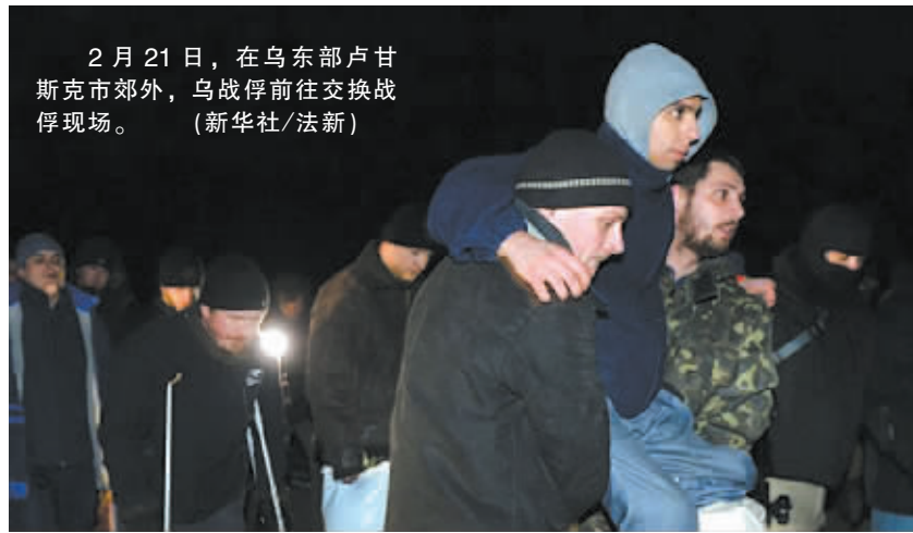
2月21日,在乌东部卢甘斯克市郊外,乌战俘前往交换战俘现场。

近争夺杰巴利采沃的激战中被俘。民间武装上周猛攻杰巴利采沃,称这是“顿涅茨克人民共和国”的“内部事务”,与停火协议无关。民间武装宣布包围政府军,表示愿意开辟“绿色通道”让政府军放下武器安全离开,但遭