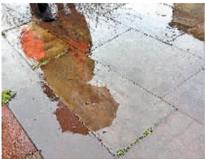
(记者 洪茜茜 整理)