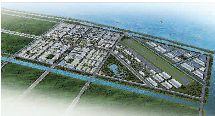
宁波杭州湾新区通航产业园效果图。