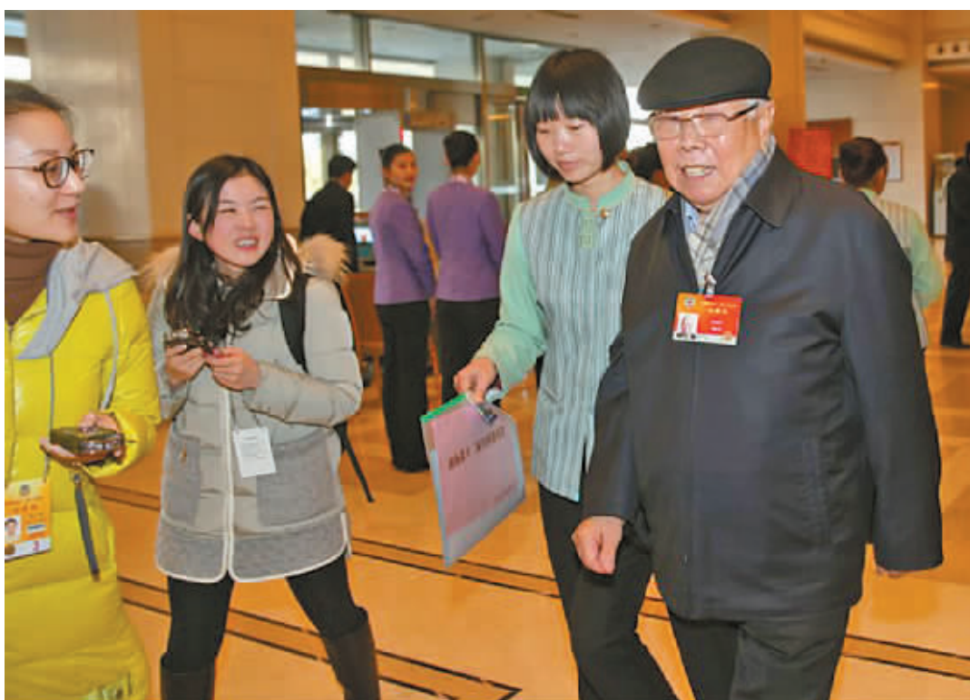
3月1日,96岁高龄的全国政协委员李辅仁(右一)抵达北京会议中心报到。当日,出席全国政协十二届三次会议的委员陆续报到。