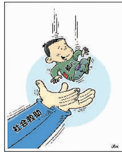
新华社发 徐毅 作

低保边缘的家庭引起重视。“低保边缘家庭不同于低保家庭，其贫困的主要原因是家庭成员重大疾病、残疾或遭遇严重自然灾害。应推行低保边缘家庭专项救助制度。科学分析救助对象的致贫原因和程度、需要救助时间长短等因素，有针对性地制订相应的社会救助策略。”郑惠强说。(新华社北京3月3日电)