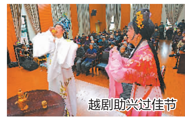
近日，江东南郊街道宁丰社区举行“浓浓敬老情·曲艺闹元宵”主题活动，20余名文化志愿者带着《打金枝》、《楼台会》等经典剧目，为怡康院80多位老年朋友送去一台曲艺大餐。