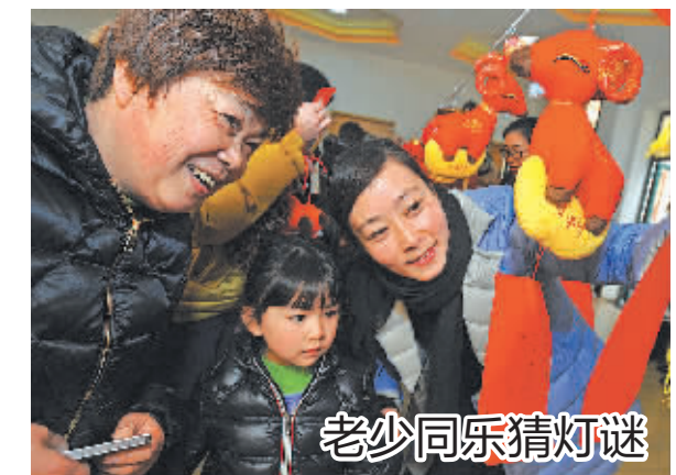
前天下午，近百位居民在李惠利幼儿园樱花分园参加了由东胜街道樱花社区举办的迎元宵“老少同乐猜灯谜”活动。