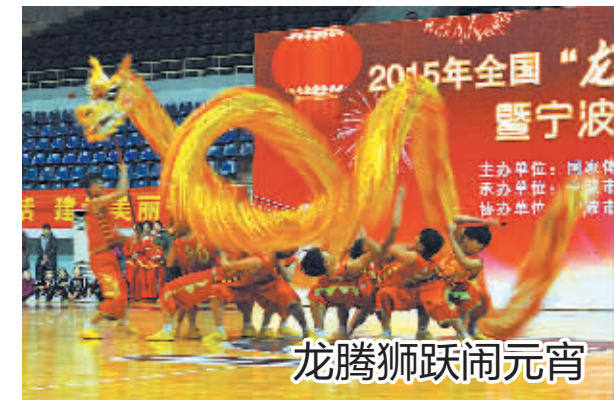
昨天下午，2015年全国“龙腾狮跃闹元宵”暨宁波市舞龙表演大赛在市雅戈尔体育馆举行，来自全市13支代表队的211名运动员参加了本次大赛。图为比赛现场。

虽然昨天宁波下起了雨夹雪，但是前来参加元宵灯谜活动的市民还是络绎不绝。在图书馆一楼大厅的门口，等待抽题猜谜的市民排成了长队。