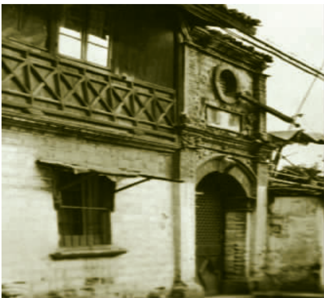
中共宁波党、团组织秘密机关所在地——醋务桥启明女中旧址