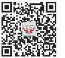
“宁波就业创业” 微信二维码