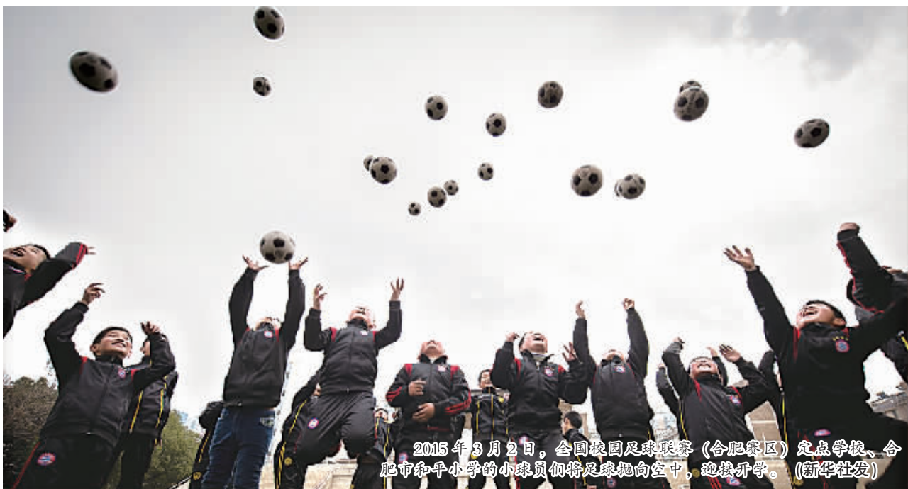
2015年3月2日,全国校园足球联赛(合肥赛区)定点学校、合肥市和平小学的小球员们将足球抛向空中,迎接开学。