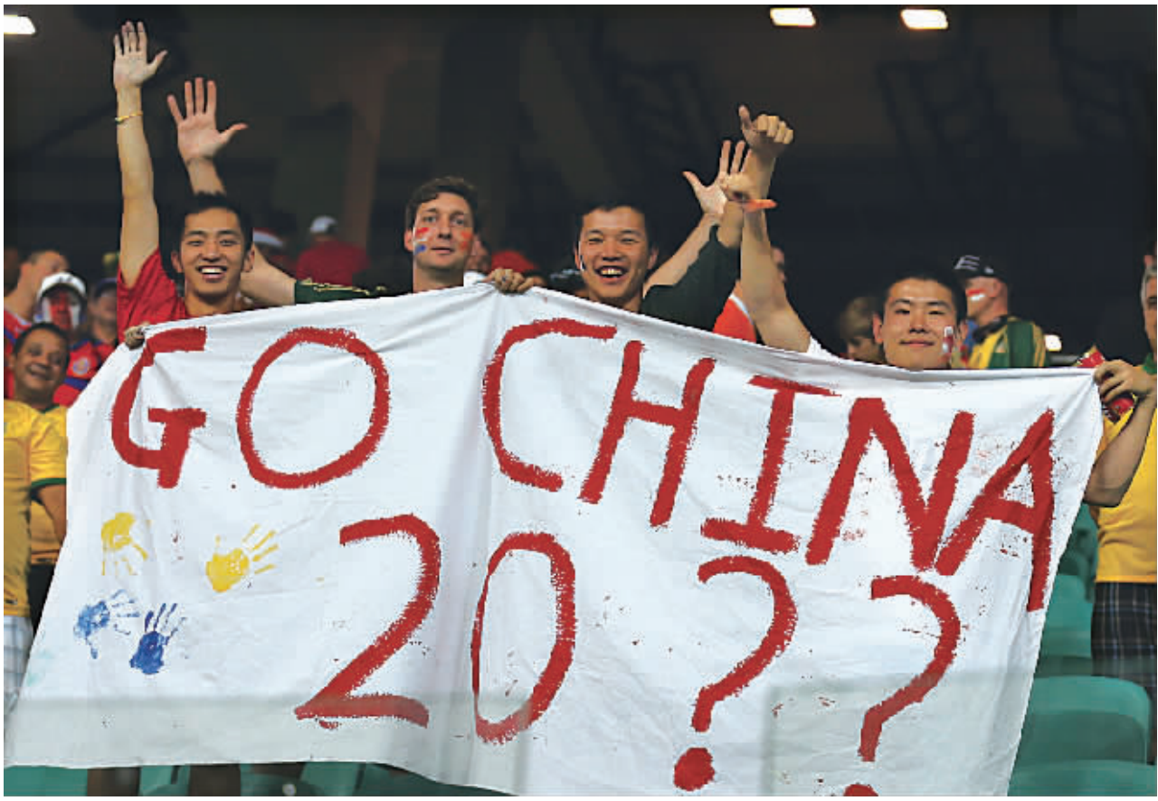
2014年7月5日,在巴西世界杯荷兰队与哥斯达黎加队的四分之一决赛中,看台上的中国球迷打出标语表达对中国足球的期望。

在国家高度重视的大背景下,已经经历了许多坎坷、走了许多弯路的中国足球只要按照规律办事,不再急功近利,并赢得全社会的合力支持,必将迎来光明的未来。