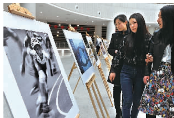
昨日，“我与体育”全国群众主题摄影展在北仑中国港口博物馆展出，活动收到来自全国各地1200多位摄影爱好者的8000余幅作品，作品展现了我国群众参与体育文化活动的真实风貌。图为市民在欣赏摄影展作品。

近日，在全省武术工作会议上，余姚市武术协会被评为2011—2014年度社会工作先进集体、2011—2014年度中国武术段位制工作先进单位和2011—2014年度中国武术协会会员制工作进步奖；尹春龙、柳伟杰、祝美芬三人被评为2011—2014年度社会武术、会员制和段位制工作先进个人。（林海 吴大庆）