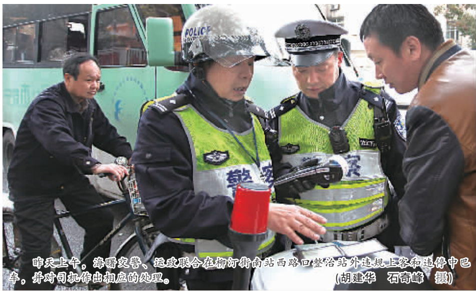
昨天上午,海曙交警、运政联合在柳汀街南站西路口登临站外违规上客和违停中巴车,并对司机作出相应的处理。