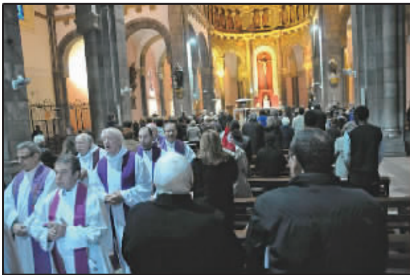
▲3月21日，人们在突尼斯市天主教堂内参加悼念巴尔杜袭击案死者的弥撒。