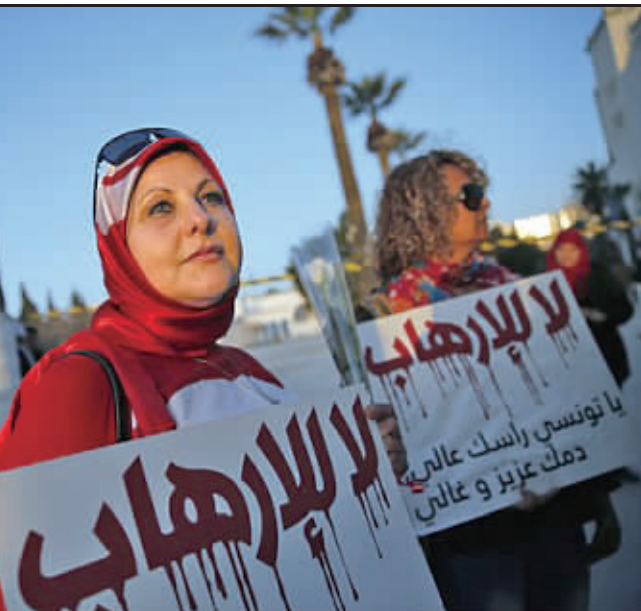
▲3月19日，在巴尔杜博物馆外，一名妇女在抗议活动中手举写有“拒绝恐怖主义”的标语牌。(新华社发)

两人可能在利比亚第二大城市班加西、极端组织“伊斯兰国”在利比亚的重要据点德尔纳等地的训练营逗留过。