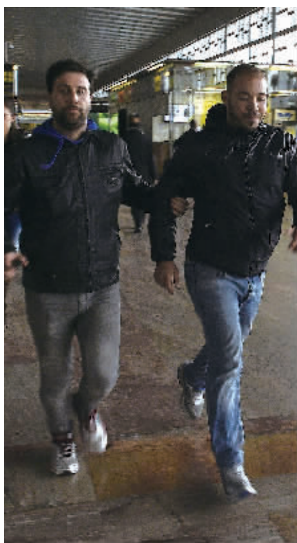
3月24日,在西班牙巴塞罗那埃爾普拉特机场,一名警察(左)护送一名机上人员的亲人。

报道说,这架空客320客机属于德国之翼航空公司。德国之翼航空公司是总部设于科隆的低成本航空公司,是德国汉莎航空公司全额控股的子公司。