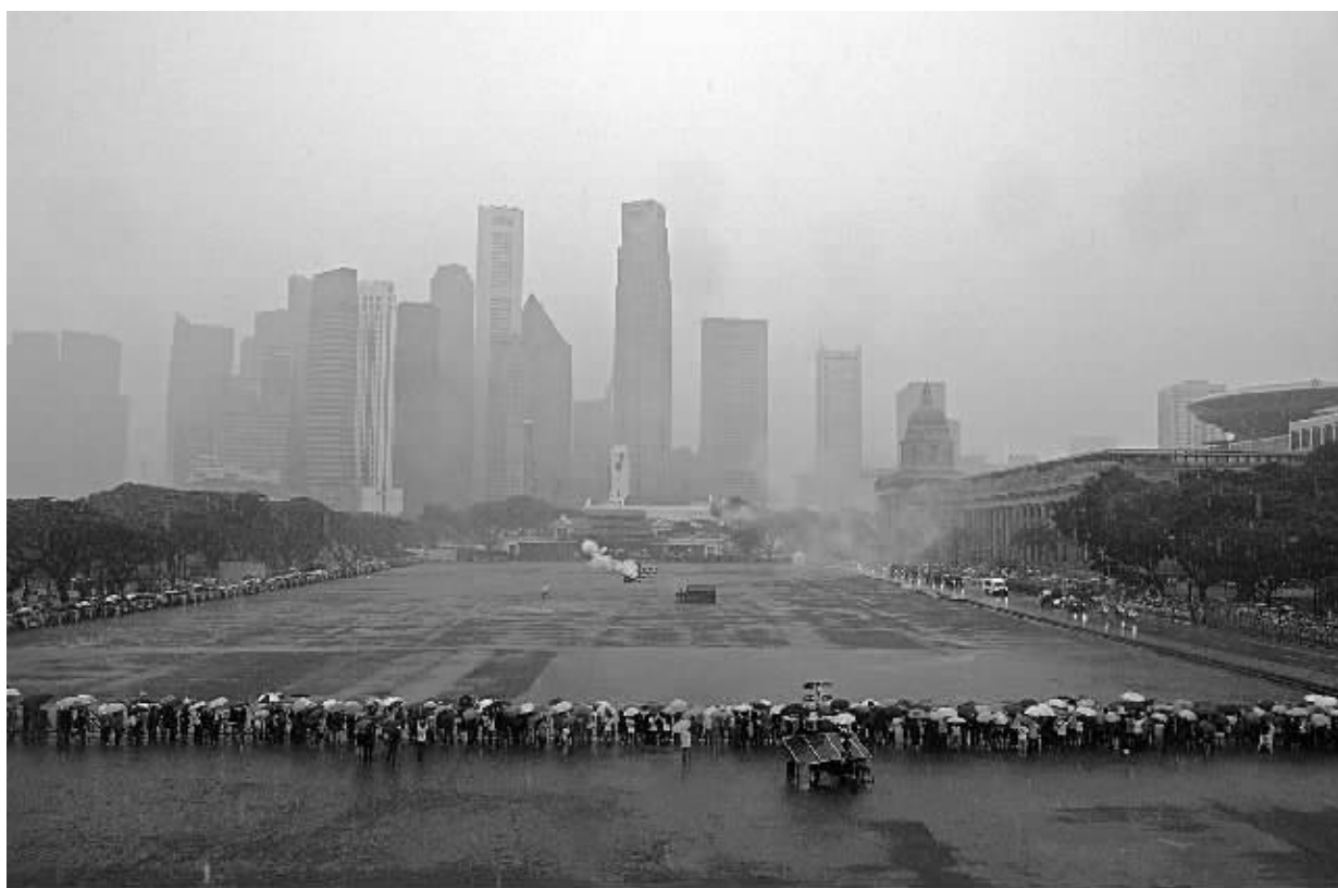
3月29日，在新加坡，民众冒雨目送新加坡前总理李光耀的灵柩。