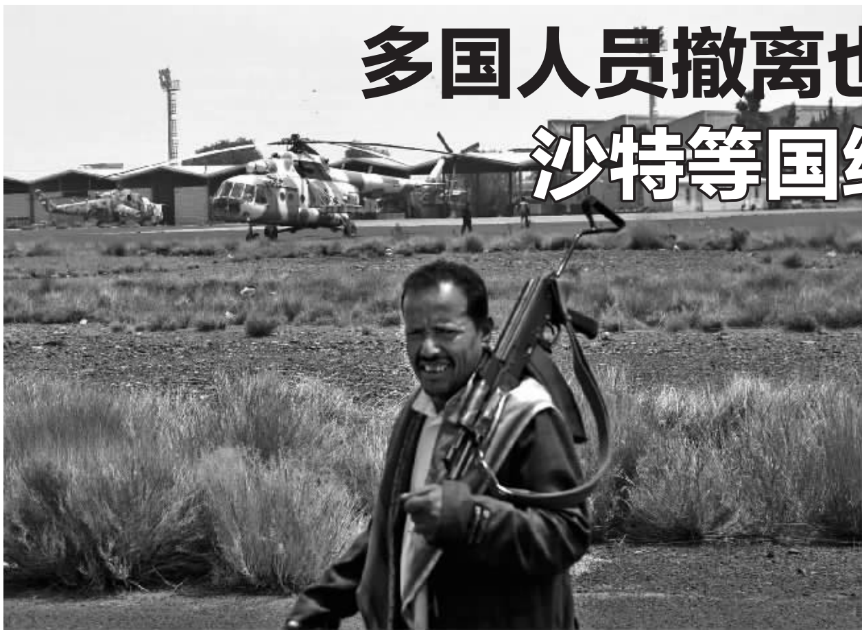
3月28日，一名武装人员在也门萨那国际机场戒备。