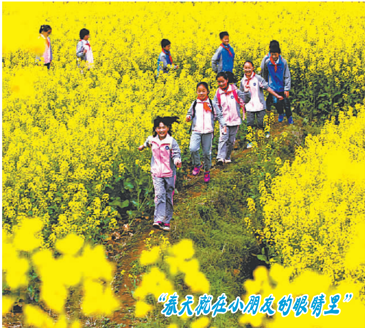
“春天就在小朋友的眼睛里”

诉。去年11月4日,中共宁波市委官方微博“东方廉政”发布微博,据宁波市纪委有关负责人证实,宁波市重点建设工程招标投标办公室原主任汪多根涉嫌严重违纪,目前正接受组织调查。