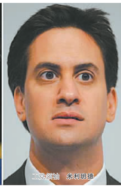
工党领袖 米利班德

在经济领域，保守党致力于继续削减财政赤字，改善就业，为更多企业提供创业贷款，为青年人提供“学徒”培训机会；工党则承诺提高最低工资，禁止雇主与员工签订“剥削性”的无固定工时合同，实现财政盈余等。 在移民问题上，保守党主张延长外来移民在英国申领社会福利的等待期，通过谈判促使欧盟改革移民规定等；工党则计划增加边检工作人员，