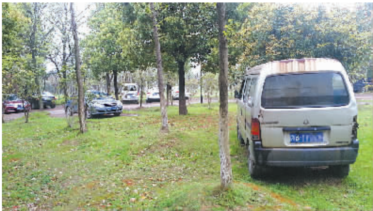
因为钻进绿化带中的违停车。