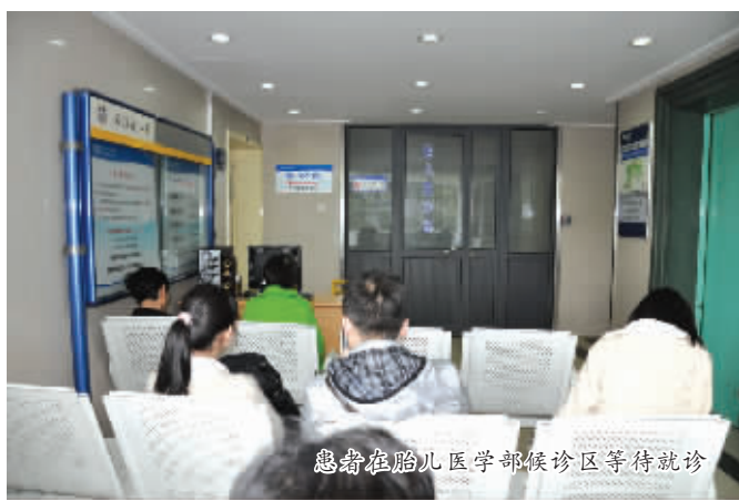
胎前胎儿医学部候诊区等待就诊