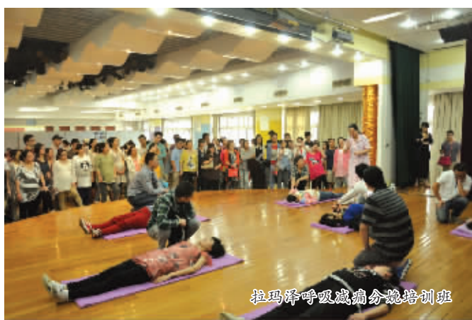
拉玛泽呼吸减痛分娩培训班