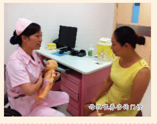
母乳喂养咨询门诊

危重孕产妇的成功抢救，除了市妇儿医院各级医护人员的努力外，也离不开各级卫生行政管理部门和宁波市危重孕产妇抢救专家组的支撑。为提高抢救成功率，该院在原有危重孕产妇抢救专家组的基础上又在科内成立了两个抢救小组，使更多优秀的临床医生参与危重孕产妇的救治。平时，除应对繁重的临床工作外，产科不断加强科研和教育能力，连续 7 年成功申报产科省级和国家级继续教育培训班，并每年举行，除本院专家讲课外，同时邀请全国著名的产科专家来宁波授课，吸引了本市和周边地区的产科医生参会，每年参加培训班人数接近 200 人次，提高了宁波市产科整体的医疗水平。此外，该院产科经常开展各种演练，提高医护人员的配合度和应急能力。同时，产科还不断加强学习培训和对外交流，用中午和晚上的休息时间每月举办住院医师读书会、报告会、疑难病例讨论、产科安全会议等各种学习例会。为掌握不断更新的学科知识，提高医疗技术水平，该院每年派遣数十名医生参加国家级继续教育培训班和各类亚专科的学术会议，每年派遣 1 名—2 名医生去国内著名医院或国外进行专科进修学习，为每个亚专科培养学术骨干和学科带头人，使该院产科医疗技术和服务理念紧跟国际前沿。