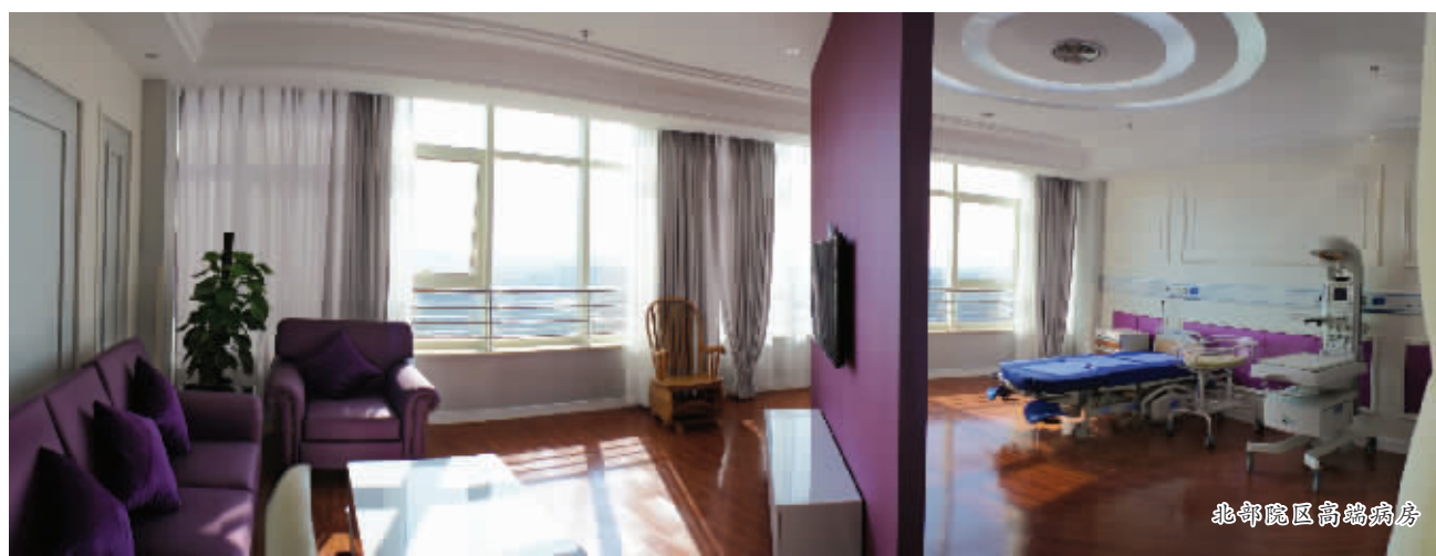
北部院区高规格病房